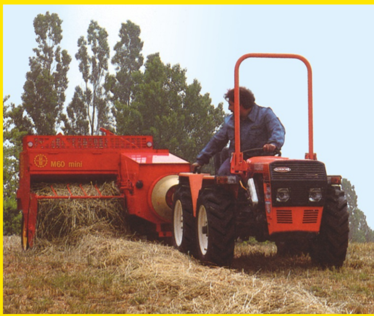
Macchina al lavoro Machine at work