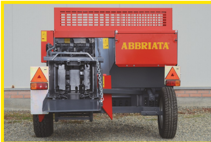
Vista posteriore con ruota montata a tergo raccoglitore Rear view with the side pick-up wheel mounted behind